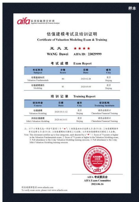
估值建模考试及培训证明